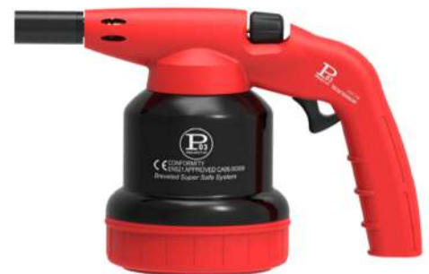
405506 ACC. PIEZO