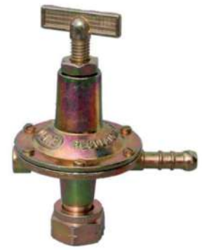
405502 ALTA PRESSIONE