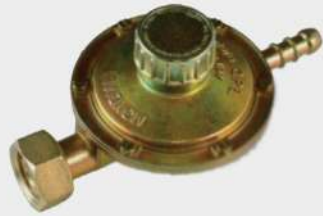
405501 NORMALE 405509 EXTRA