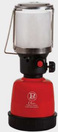
405504 ACC. PIEZO