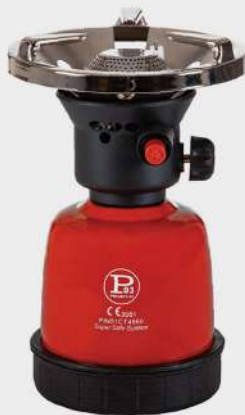
405505 ACC. PIEZO